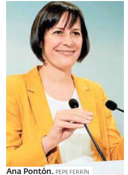
Ana Pontón. PEPE FERRÍN

Ese non é o Juan Carlos I co que quero quedarme. Recordo perfectamente o golpe de Estado do 81. Estaba co meu pai nun bar en Bande, e tamén case a metade do pobo concentrado nel. E recordo a imaxe do rei e a tranquilidade que me transmitira. O meu pai era boticario en Bande e moita xente xa preguntaba se podería vir á nosa casa, que estaba na fronteira, para desde ela fuxir a Portugal. E entón o rei transmitiu a tranquilidade que nese momento ningún tiña. Prefiro quedarme con esa imaxe, co momento no que salvou o golpe de Estado, que con cousas menos agradables.