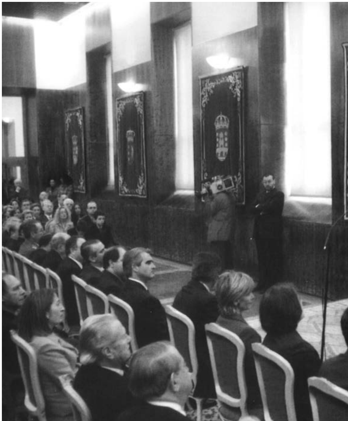
Fraga anunciou o comezo dun novo tempo en Galicia na súa toma de posesión no Salón Nobre do pazo do Hórreo, en presenza do vicepresidente do Goberno central, Mariano Rajoy, e tamén diante de Beiras e Touriño, que asistiron por primeira vez a este acto oficial.