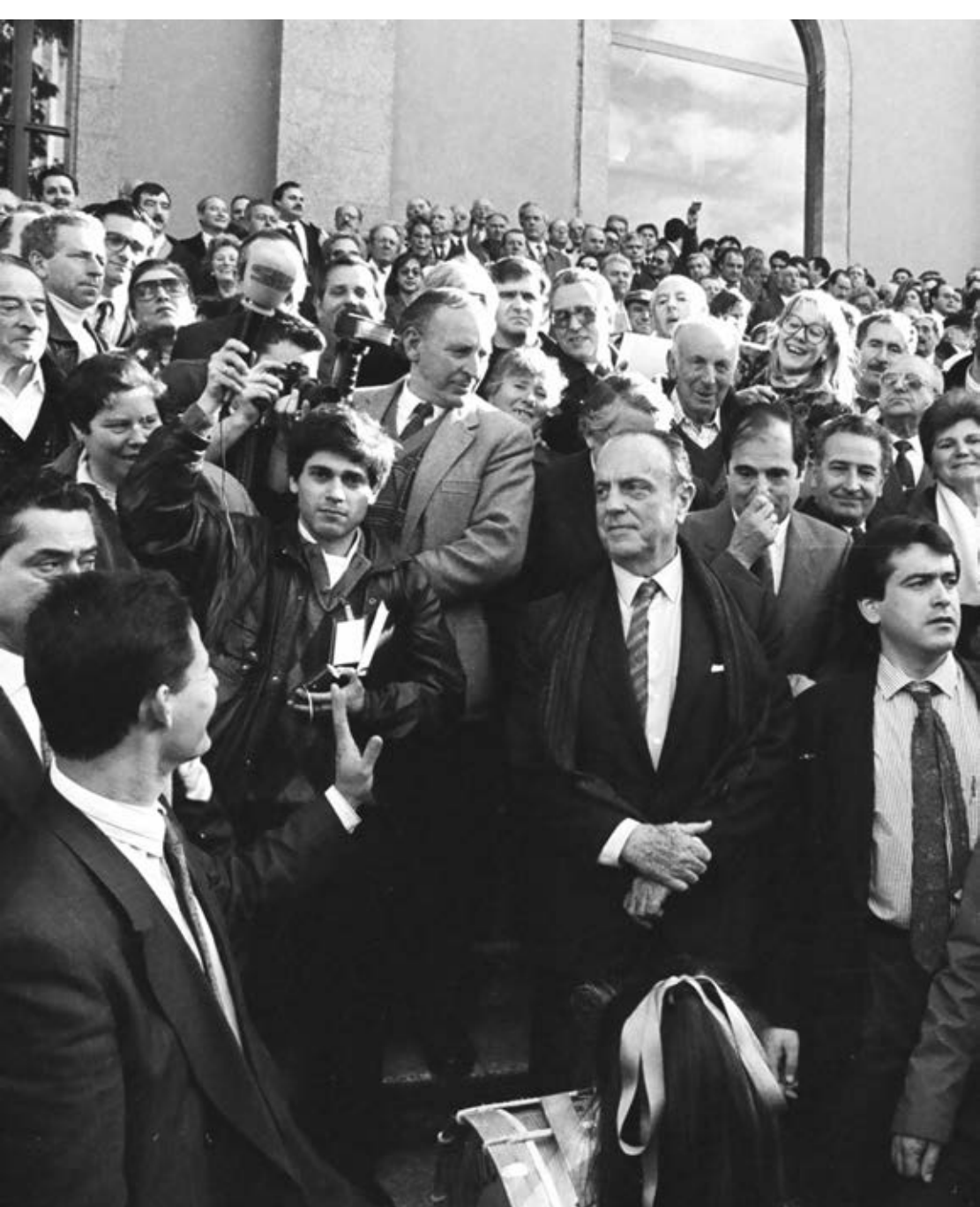
Fraga posou nas escaleiras do pazo do Hórreo cos centos de convidados, antes de facer a súa entrada triunfal no pazo de Raxoi.