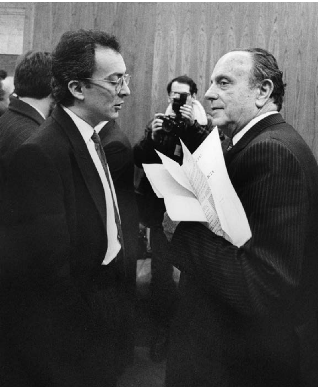
O ex-presidente Laxe felicitou a Fraga tras a súa designación polo Parlamento como presidente da Xunta de Galicia.