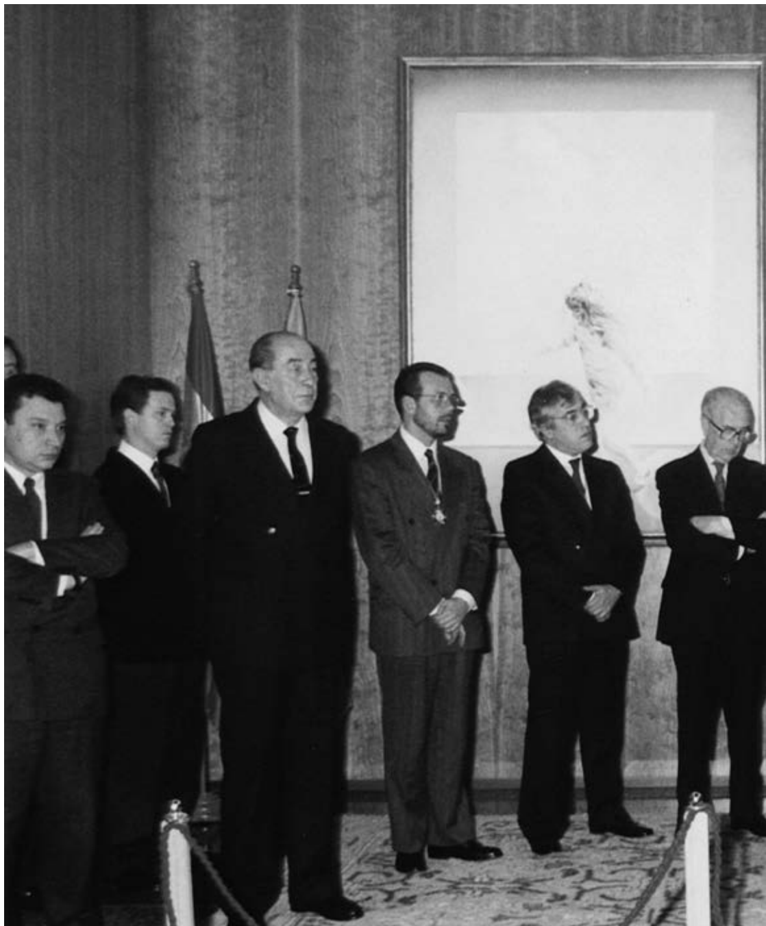
As primeiras autoridades galegas asistiron ao acto conmemorativo no Parlamento do X aniversario da aprobación do Estatuto de Autonomía de 1981.