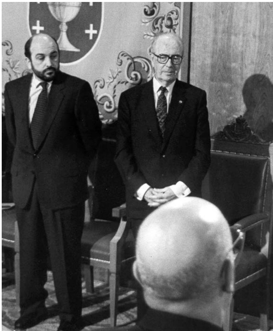
O delegado do Goberno, Domingo García Sabell, e o ministro de Administracións Públicas, Joaquín Almunia, representaron o Goberno central na toma de posesión de Fraga no salón nobre da sede do Parlamento