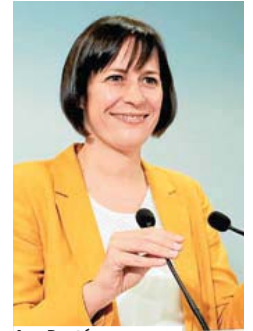
Ana Pontón. PEPE FERRÍN

Ese non é o Juan Carlos I co que quero quedarme. Recordo perfectamente o golpe de Estado do 81. Estaba co meu pai nun bar en Bande, e tamén case a metade do pobo concentrado nel. E recordo a imaxe do rei e a tranquilidade que me transmitira. O meu pai era boticario en Bande e moita xente xa preguntaba se podería vir á nosa casa, que estaba na fronteira, para desde ela fuxir a Portugal. E entón o rei transmitiu a tranquilidade que nese momento ningún tiña. Prefiro quedarme con esa imaxe, co momento no que salvou o golpe de Estado, que con cousas menos agradables.