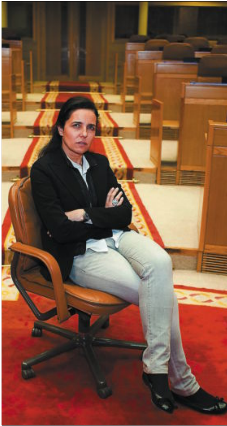
Rojo sabe que se la valorará por el manejo del reloj.

El día de su estreno, Rojo cometió su particular manda huevos al levantar la sesión con el "himno nacional". El lapsus lo cazó al vuelo el BNG, que celebró con sorna que una diputada del PP abrazara sus tesis sobre la condición nacional de Galicia. "Lo que me da rabia es que fuera la última palabra la que lo machacara todo", reconoce entre risas. "Al final es una anécdota. Lo peor es el intento de mani-